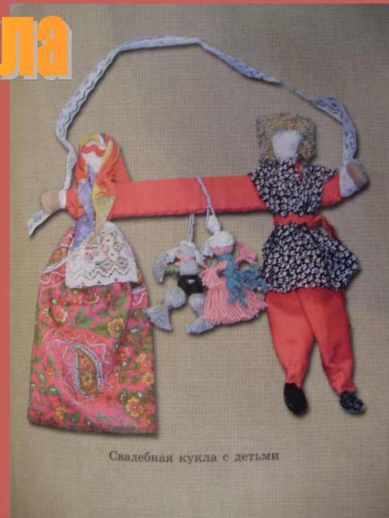
Свадебная кукла с детьми

Женское и мужское начала соединялись в единое неразрывное целое. Кукол изготавливали подруги невесты из лоскутков белой, красной и другой разноцветной ткани, используя обрывки разноцветных нитей.