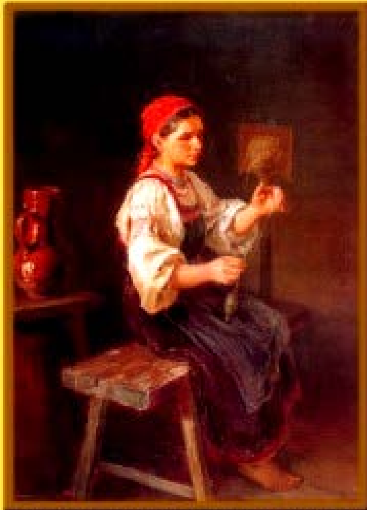
Раньше пряли льняную нить на прялке.