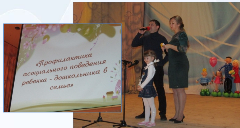
КВН «Права и обязанности»