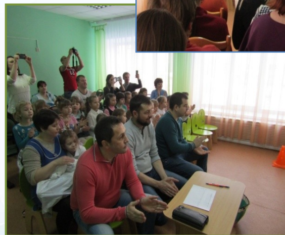
Дни открытых дверей