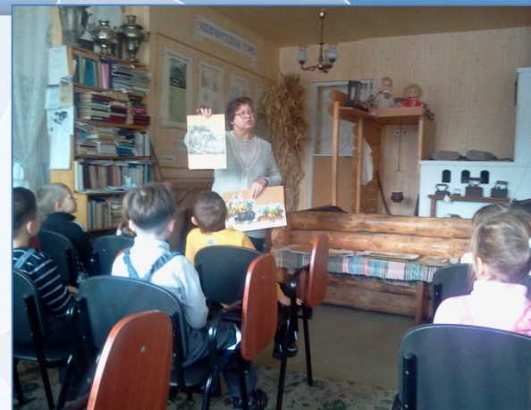
Посещение Русской избы в ЦВР «Алиса»