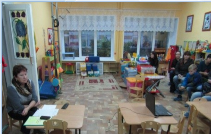
Обмен опытом по развитию игры в домашних условиях