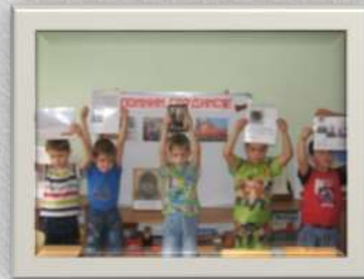
Стена «Помним .Гордимся»