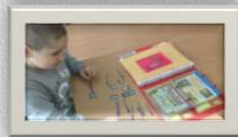
д/и «Ордена и медали»