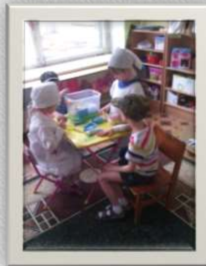
С/р игра «Госпиталь»