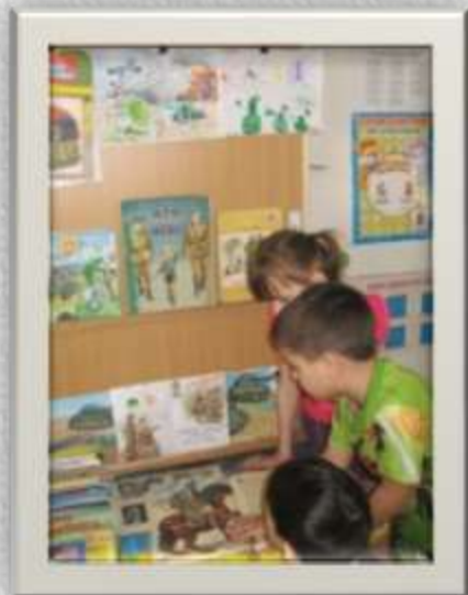
Рассматривание иллюстраций в книжном уголке