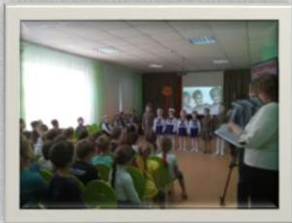
Встреча с представителем из общества ветеранов