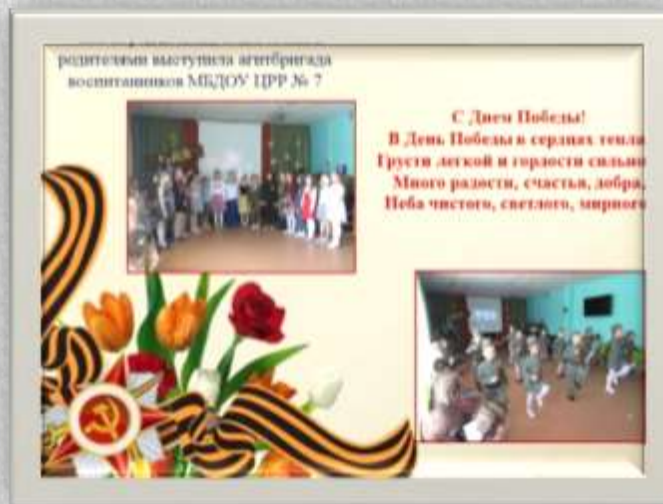
музыкальная композиция «Мы помним мы не забыли»