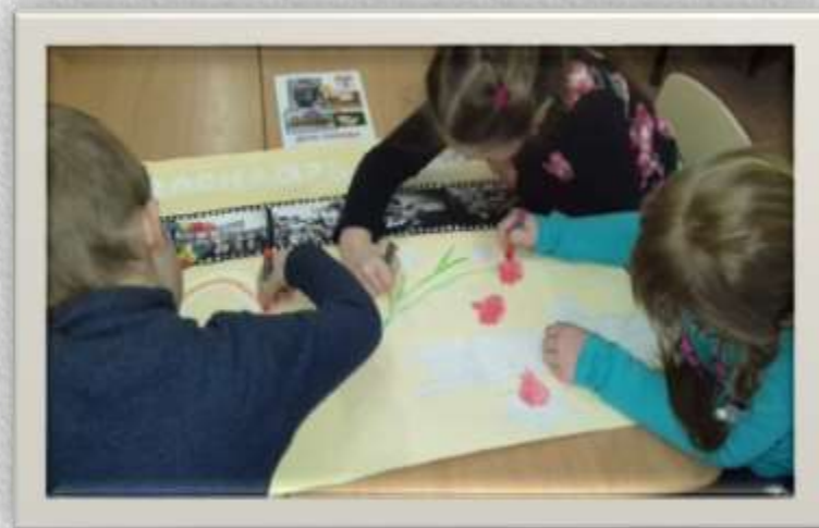
Изготовление календаря Победы