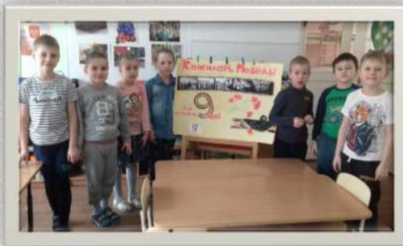
Календарь Победы . «До дня Победы осталось...»