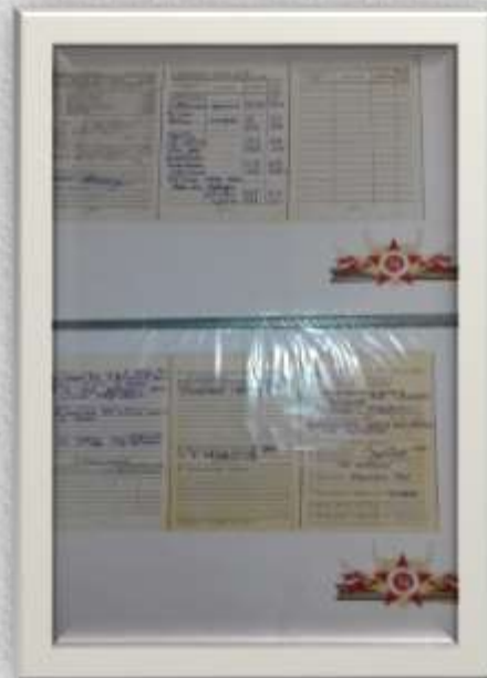
Книга памяти «Помним. Гордимся. Благодарим»