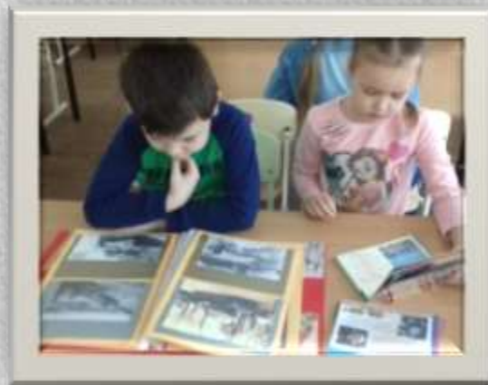
Рассматривание открыток «Города герои»