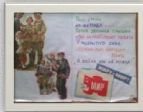
Книга «Моя Армия»