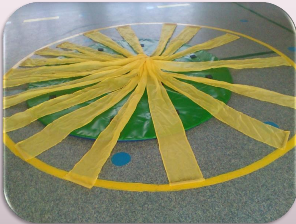
« Солнышко »