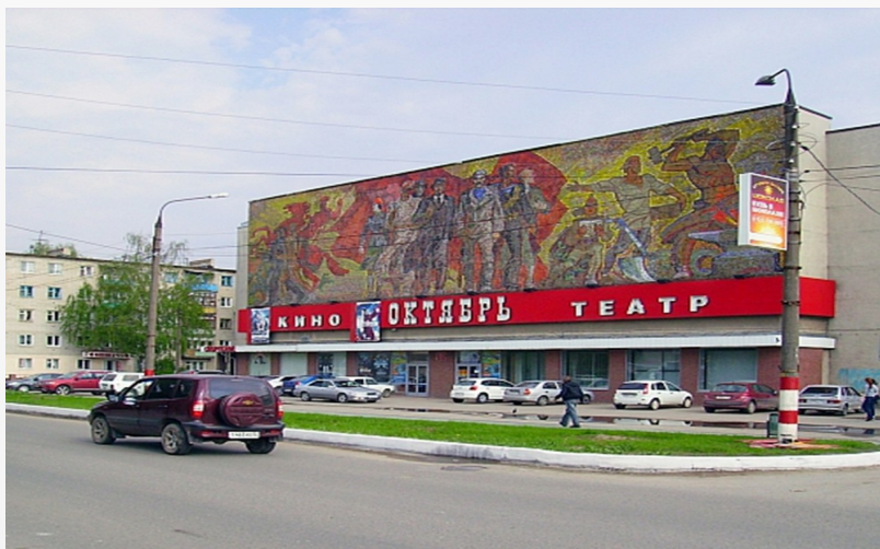
Здание ДК Октябрь