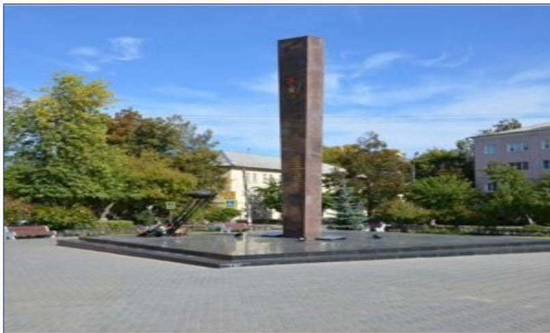
Стела (Вечный огонь)