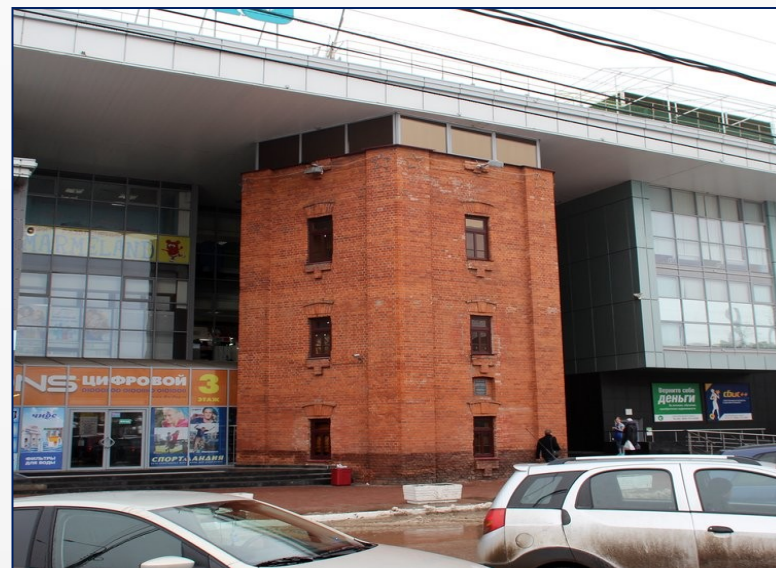
Здание бывшей пожарной башни