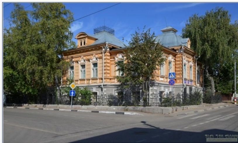
Дом Бугрова (краеведческий музей)