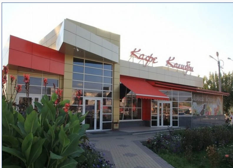
Здание детского кафе