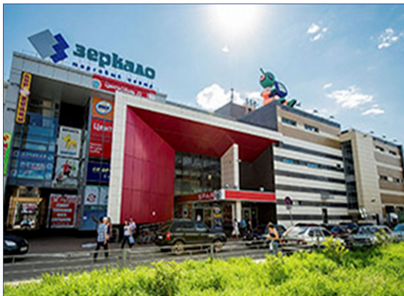
Здание торгового центра